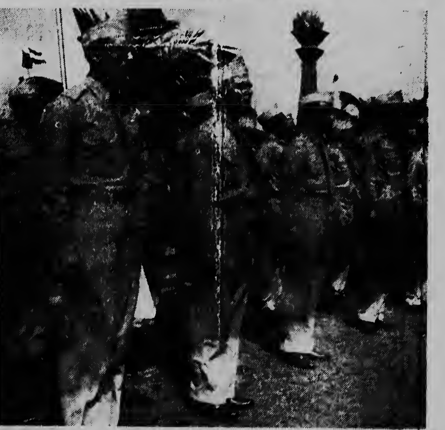
Y aki nos tin e humbernan di Kolonne Rode Kruis, para stran den houding

Ricibi gratis un botter di Shampoo Drene (Corona di oro)